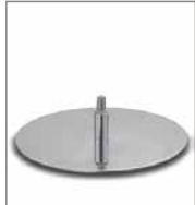
Drehteller versch. Metallfarben 3 Sitzh. - FU2, Auf- F 6Q