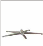
5-Sternfuß versch. Metallfarben 3 Sitzh. - FU1 F 99