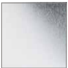
Chrom glän- zend