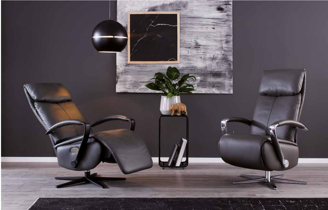
Bezug: Z69/95 anthracite