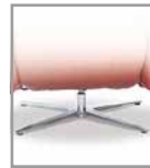
Kreuzfuß, Stahl nickel-satiniert - FU 4., Aufpreis F U4.