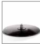
Holzplatte - versch. Beiztöne - FU 3., Aufpreis F U3.