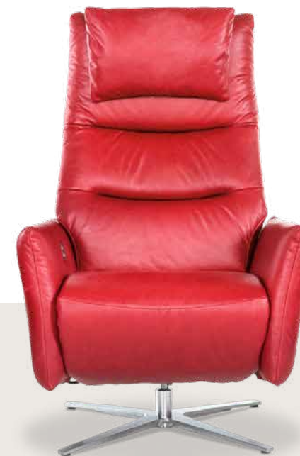
Bezug: Z62/14 rosso

Dieser Sessel ist mit seiner gesteppten Rückenfläche der Blickfangpunkt in jedem Raum. Erst beim Reinsetzen gibt es dann die große Überraschung – die optionale Rücken-Seitenteilfunktion perfektioniert den Sitzkomfort. Der edle Drehtellerfuß ist in verschiedenen Metallfarben lieferbar.