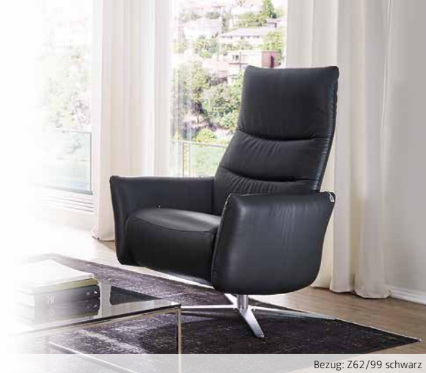
Bezug: Z62/99 schwarz