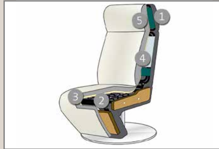
Das Design des hier abgebildeten Querschnitts entspricht nicht dem Modell dieses Katalogblattes.