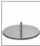
Tellerfuß - versch. Metallfarben - FU 2., Aufpreis F U2.