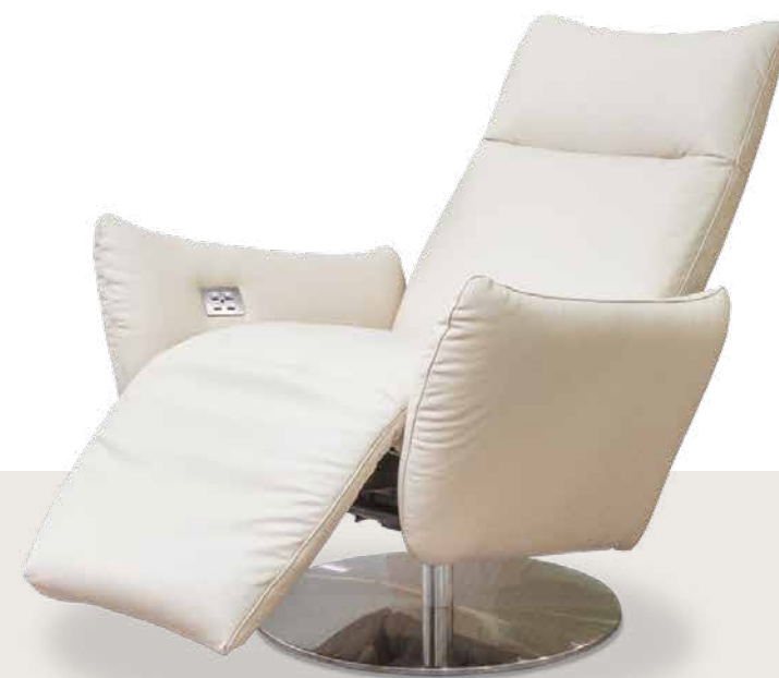
Bezug: Z62/46 creme

Sitzkomfort empfindet jeder anders - und genau darauf geht das ergorelaxx -Programm ein. Das Kopfteil ist stufenlos verstellbar. Die Rückenlehnen lassen sich durch einfache Gewichtsverlagerung bequem nach hinten neigen. Weitere Verstellmöglichkeiten bestehen manuell (via Einsatz einer Gasdruckfeder) oder motorisch.