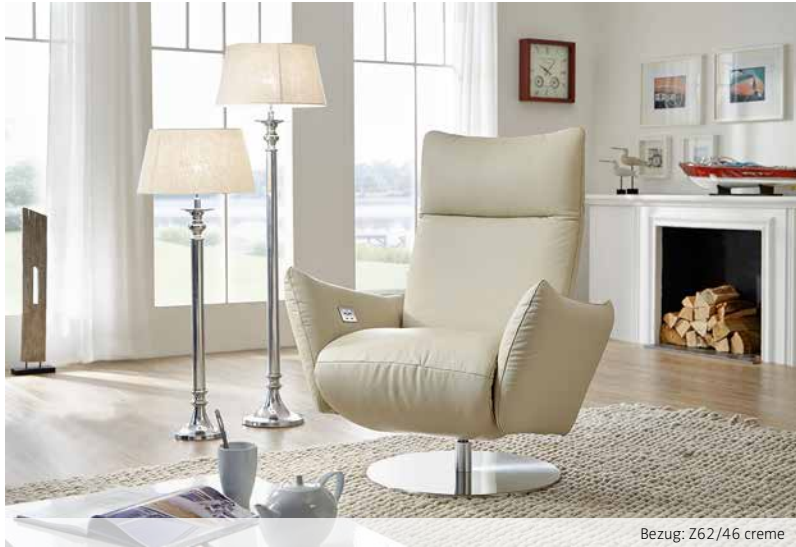
Bezug: Z62/46 creme