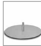
Drehteller, matt - FU 3, Aufpreis F PM