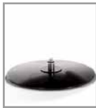
Holzteller, versch. Beiztöne - FU 2, Aufpreis F U2