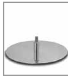
Drehteller, Chrom glänzend - FU 3, Aufpreis F PG