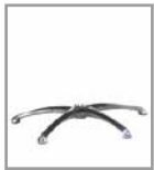
Sternfuß Chrom glänzend - FU 1 F SG