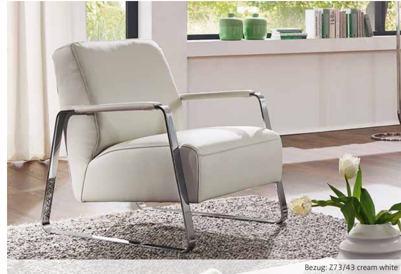
Bezug: Z73/43 cream white