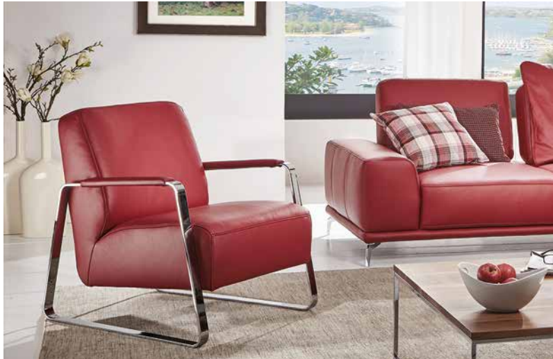
Bezug: Z73/11 ruby red