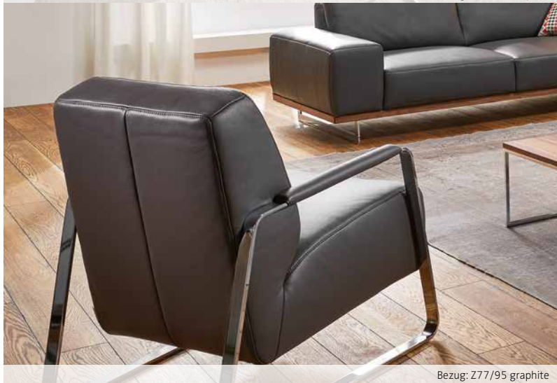
Bezug: Z77/95 graphite