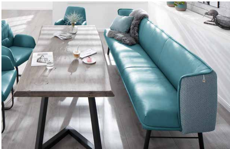
Bezug: Rücken/Seitenteil außen V49/27 blue; Sitz/Rücken/Seitenteil innen Z79/26 petrol blue