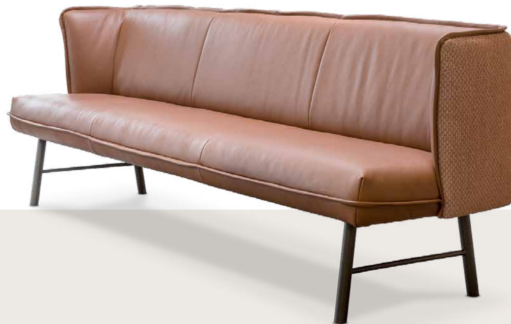
Bezug: Rücken und Seitenteile außen V49/50 chestnut, Rücken innen und Sitzfläche Z77/52 chestnut

... mit klassischem Charme. Ein unglaublicher Sitzkomfort empfängt die Gäste und lässt den Abend an Komfort nicht übertreffbar vorüber ziehen. Die Bezüge der Rückenlehne sind kombinierbar und lassen dadurch viel Gestaltungsfreiraum . Metallgestelle runden die Optik perfekt ab.