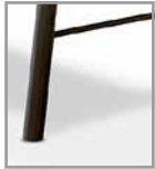
Metallgestell schwarz M99