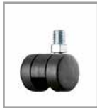
Kunststoff-Doppelrolle (2 cm höher)