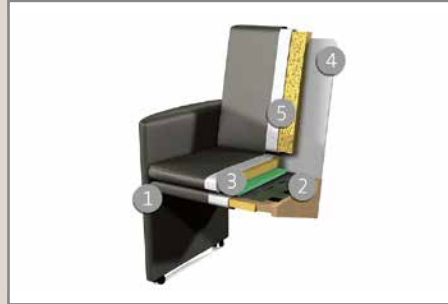
Das Design des hier abgebildeten Querschnitts entspricht nicht dem Modell dieses Katalogblattes.