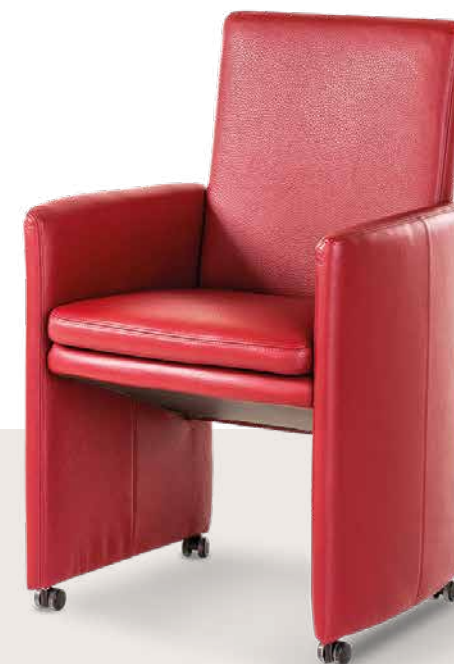
Bezug: Z73/11 ruby red

Der frei schwingende Rücken gibt Ihrem Kaffee den erfrischenden Kick .