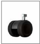
Parkettrolle (2 cm höher)