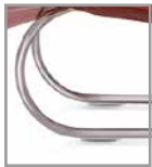
Freischwingergestell silber pulverbesch.