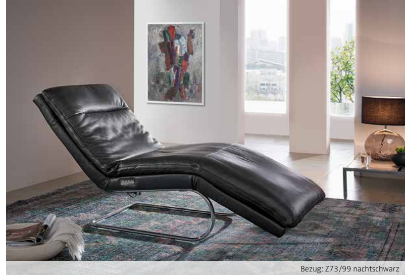
Bezug: Z73/99 nachtschwarz