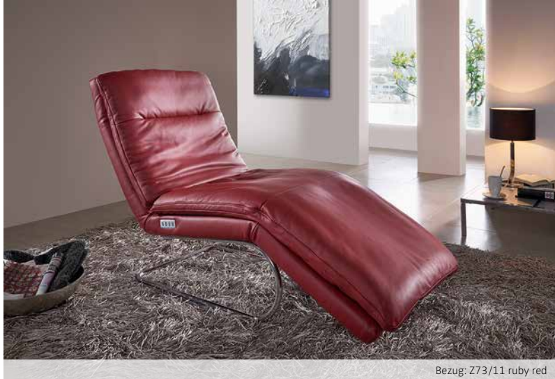
Bezug: Z73/11 ruby red