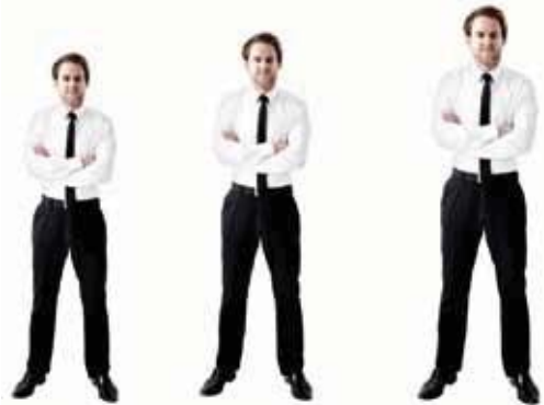
S bis ca. 165 cm

Der Sessel ist in jeder Ausführung in den 3 Größen S, M, L erhältlich. Alle relevanten Komfortgrößen (Sitzhöhe, Sitztiefe, Fußklappenlänge, Rückenhöhe) wachsen im Verhältnis mit, angepasst an alle Körpermaße.