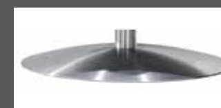
„N“ - Edelstahl-Optik