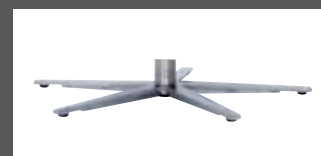
„S“ - Sternfuß verchromt