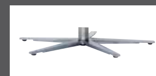
„U“ - Sternfuß Edelstahl-Optik