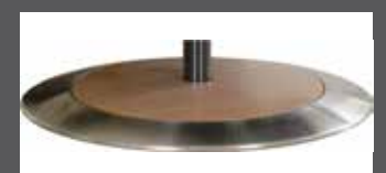
„D“ - Holz mit Edelstahlring