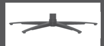
„V“ - Sternfuß Anthrazit pulverbeschichtet

- alle elektrischen Varianten können mit aussenliegendem Akku geliefert werden.