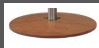
„A“ - Holz